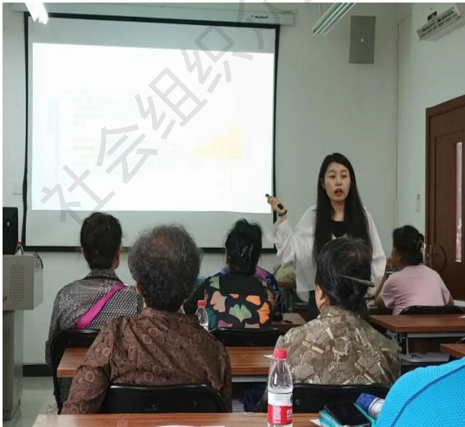
“能人种子”心理服务能力赋能培训