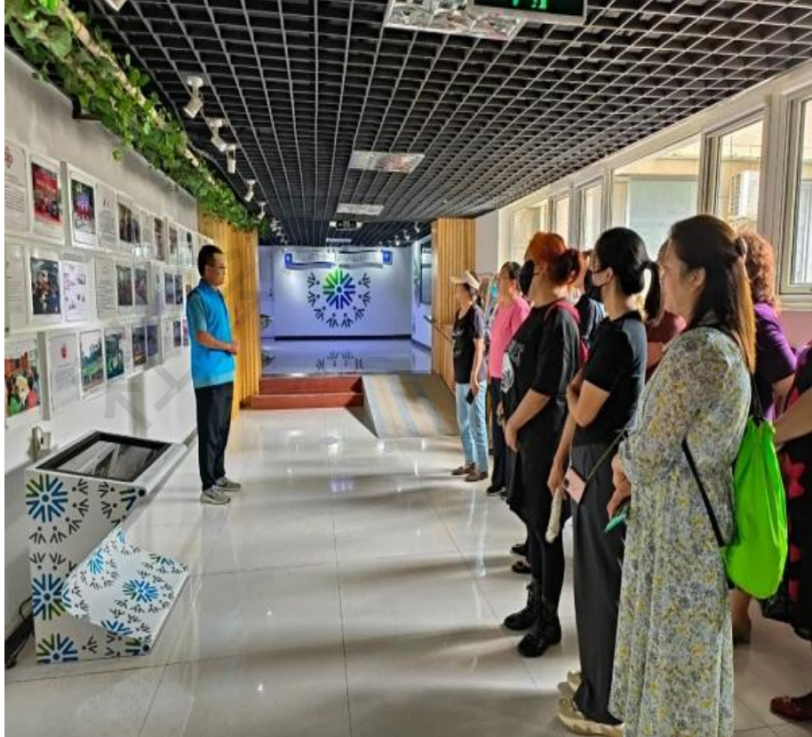
参观过程中，马主任详细介绍了玉桥街道孵化基地社区社会组织参与社区治理的新机制和新模式。孵化基地创新“双平台+三五工作